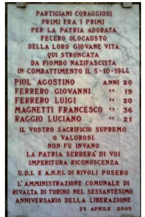
La lapide a RIVALTA